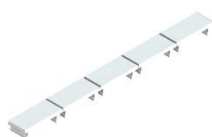
Бирки маркировочные БМ