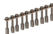
Перемычки (мосты поперечного соединения)