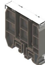
Концевой фиксатор КП2-У3

ЗН27-25М100, ЗН27-50М160, ЗН27- 70М200, ЗН27-95М250