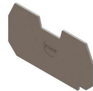
Крышка торцевая КТИ 40