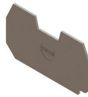
Крышка торцевая КТИ 25