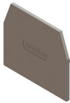
Крышка торцевая КТМ 25-63

ЗН27-2,5М25, ЗН27-4М32, ЗН27-6М40, ЗН27-10М63