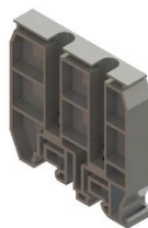
Концевой фиксатор КП2-У3

ЗН27-2,5М25, ЗН27-4М32, ЗН27- 6М40, ЗН27-10М63, ЗН27-16М80