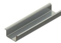
Рейка тип 2 DIN рейка P2-3, NS35/15