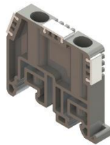
Концевой фиксатор КП1-У3

ЗН27-2,5М25, ЗН27-4М32, ЗН27- 6М40, ЗН27-10М63, ЗН27-16М80