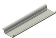
Рейка тип 2 DIN рейка P2-1, NS35/7.5